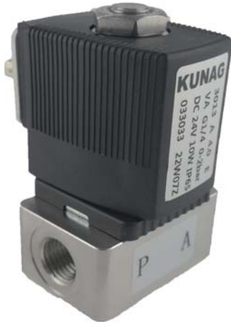
Circuit function A