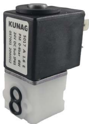
Circuit function A