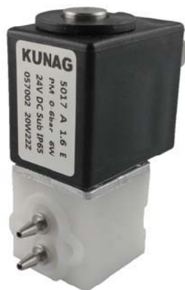
Circuit function A