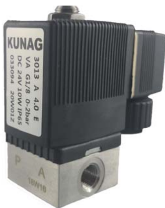
Circuit function A