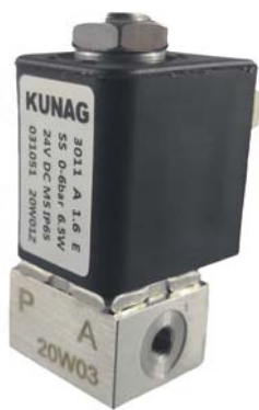
Circuit function A