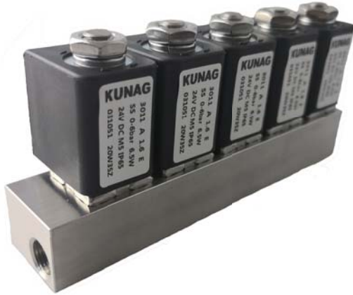
Circuit function A